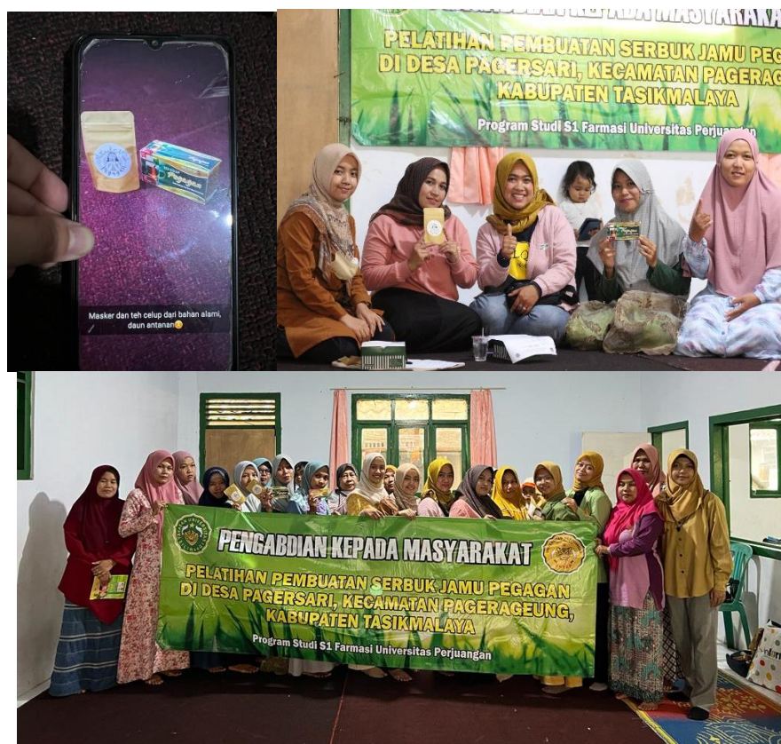
Gambar 2. Kegiatan praktik dan Presentasi produk

Kegiatan pelatihan berlangsung lancar dan masing-masing kelompok dapat mempresentasikan hasil produknya yakni masker pegagan. Hal ini dapat dilihat dari hasil dokumentasi berikut: