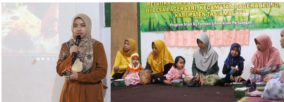
Gambar 1. Pemaparan materi dan sesi tanya jawab

Berikut ini adalah dokumentasi kegiatan pengabdian masyarakat :