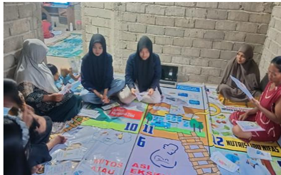
Gambar 2 mengisi Pre-test dan Post-test

Setelah permainan selesai, kami membagikan kembali lembar post-test sebagai evaluasi akhir peserta untuk mengetahui apakah dari penyuluhan ini pengetahuan peserta bisa bertambah. Hasil dari pengisian Kuesioner pre-test dan post-test kami analisis dan membandingkan untuk mengetahui apakah ada peningkatan pengetahuan pada peserta, Terlihat Perbandingan itu pada Gambar 4. Dari jawaban yang diberikan pada Kuesioner pre-test, kita dapat mengetahui, pengetahuan mahasiswa mengenai ASI eksklusif sudah tergolong baik, sehingga pada saat melakukan penyuluhan, peserta sudah bisa menguasai materi, pada saat kuesioner post-test jawaban peserta dominan sangat baik. Itu membuktikan pengetahuan peserta mengenai ASI eksklusif bertambah.