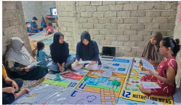
Gambar 1 Penyampaian materi tentang ASI Eksklusif.

Edukasi ini kami adakan pada ibu hamil di Dusun 2 Desa Panca Makmur, dengan jumlah peserta 3 orang. Kegiatan dimulai dengan membagi kuesioner pre-test terlihat pada Gambar, kami memberi waktu 5 menit untuk menjawab. Setelah peserta selesai mengisi pre-test, maka kami langsung memulai permainan menggunakan metode ular tangga terlihat pada Gambar 1, ketika dadu berhenti pada petak ASI Eksklusif maka mulailah diskusi dan sharing mengenai asi eksklusif serta memberi leaflet untuk penyuluhan agar menambah pengetahuan ibu seperti pada Gambar 2.